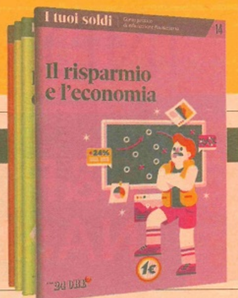
ILLUSTRAZIONE DI ANTONIO MISSIERI